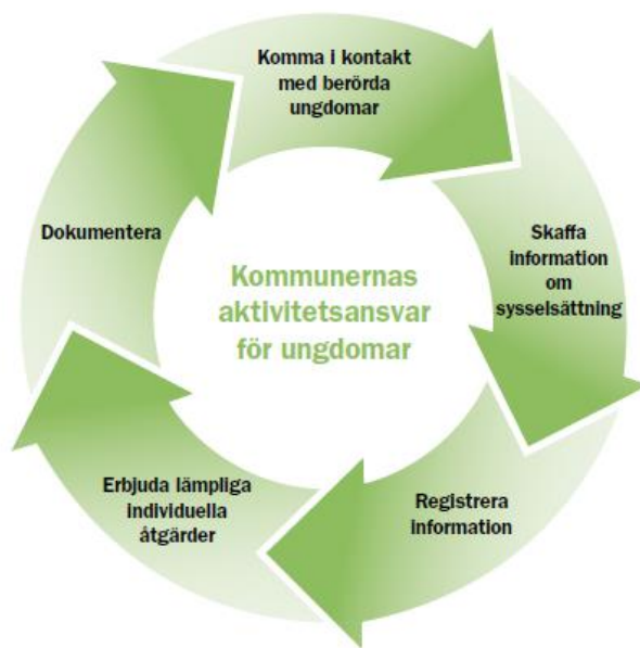
Illustration av hur kommunerna kan bedriva det löpande arbetet med aktivitetsansvaret utifrån de allmänna råden.

lämnas till Skolverket för uppföljning och utvärdering av kommunens aktivitetsansvar, anges närmare i Skolverkets föreskrifter 12 .