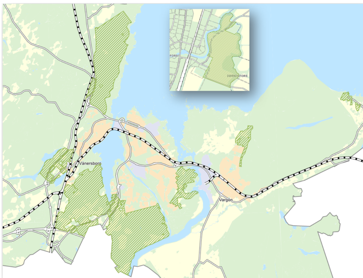
Figur 1. Jaktbar mark i kommunens ägo som ej är detaljplanerad (2024) markerad med grön rastermarkering på kartan.

Arealerna är i huvudsakligen i tätortsnära områden eller i områden med mycket friluftsliv vilket ställer höga krav på säkerheten för jaktutövandet. En tätortsnära jakt ställer högre krav på jaktledarna, passplacering med säkra skjutvinklar och kulfång då det generellt är välbesökt av friluftsmänniskor på dessa områden. I den tätortsnära skogen behöver jakten i större utsträckning samspela med andra intressen. Något som ställer större krav på dialog och samförstånd för olika intressen.